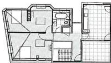
Plan du R+2.